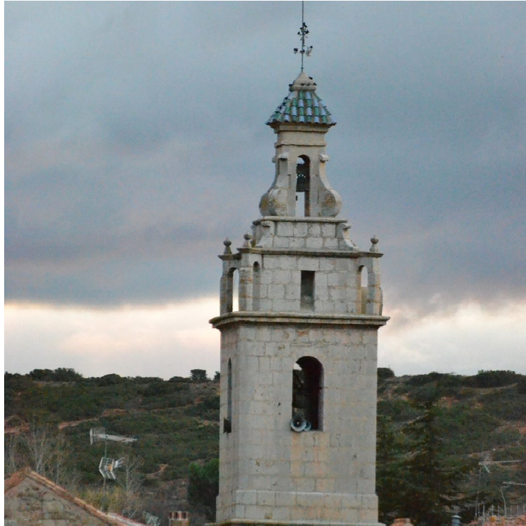
Iglesia de San Antonio Abad (Valbona)