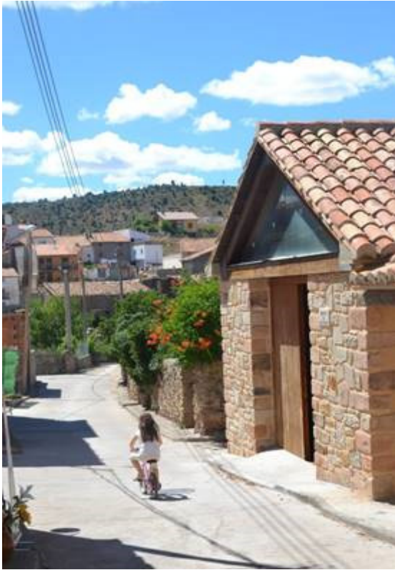
Antiguo horno de "pan cocer"