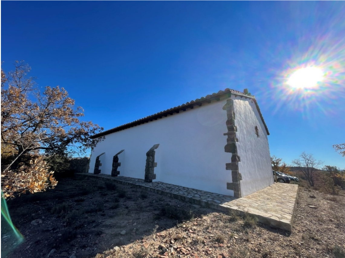
Ermita de Santa Bárbara (Valbona)