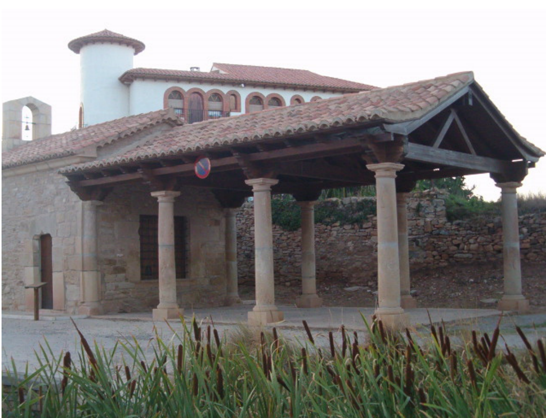
Ermita del Loreto (Valbona)