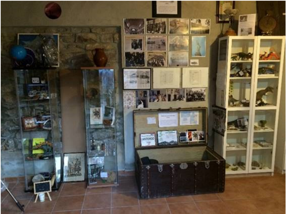
Museo de Valbona en C/Horno

Además en el blog y en la web del Museo de Valbona encontraréis diferentes actividades a realizar en el municipio y en la Comarca relacionadas con la Naturaleza y con la etnografía y la astronomía, así como las diferentes exposiciones como "Turolenses en Nueva York", "Cartas al Médico de Valbona" o "El último alfarero" (más información en http://biost3.bio.ub.edu/biost3/Museo_Valbona/ en http://museovalbona.blogspot.com.es/ )