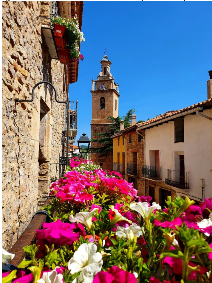
Iglesia de San Antonio Abad desde el Ayuntamiento (Valbona)