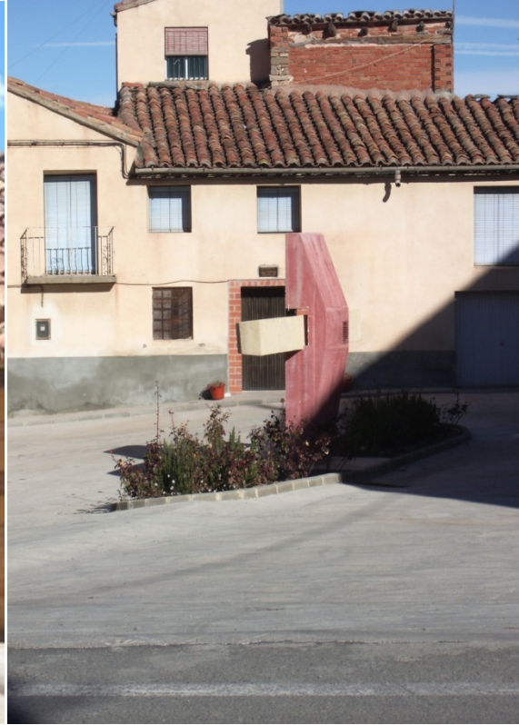
Monumento al pestillo

También posee un importante patrimonio fluvial con varios molinos, fuentes y azudes, dentro de todos los que hay destacamos el Azud de los Piquillos, El Azud de la Luz, el de los Cesteros y Molino Pina, que pueden recorrerse a través de senderos señalizados. Cuenta también con un sendero de tipo GR( GR 8) y pasa por su término el "Camino del Cid".