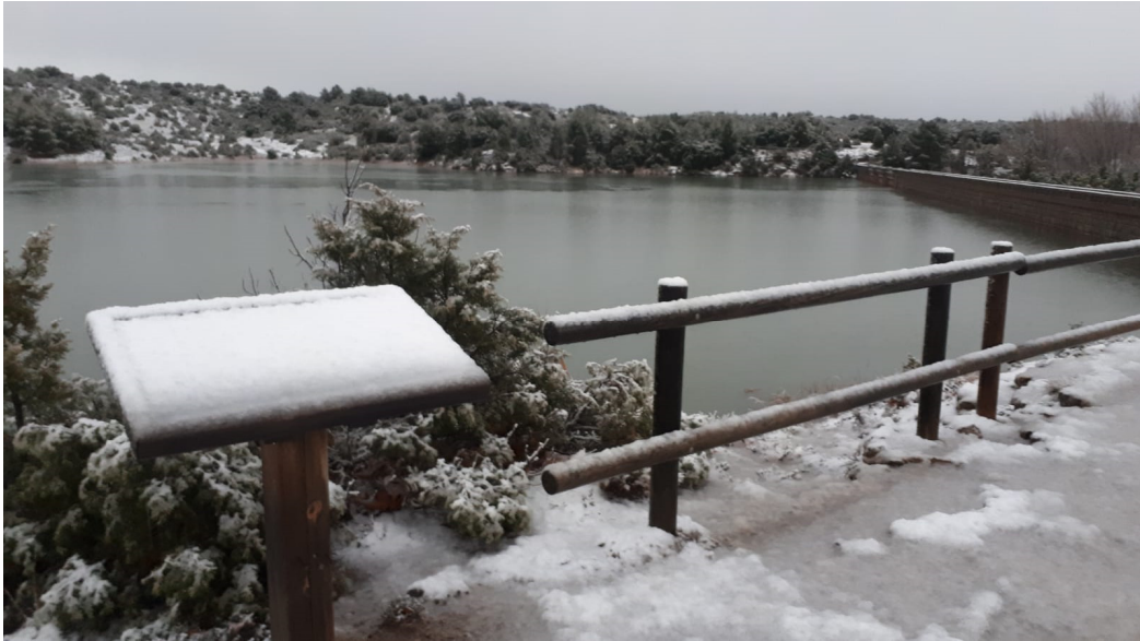
Embalse de Valbona