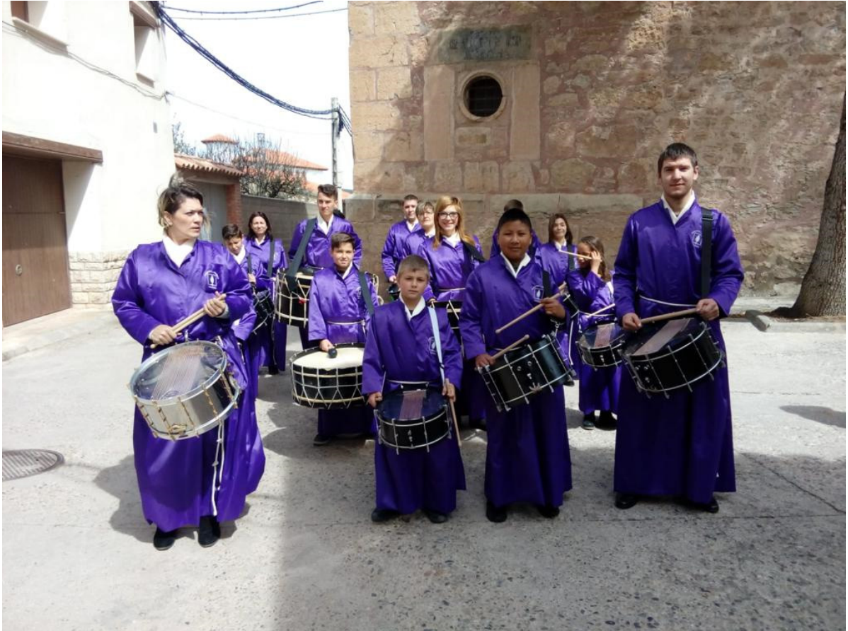
Valbona en Semana Santa

También se encuentra el Museo de Valbona que está dedicado a la Historia natural y la Etnografía de Valbona y su comarca (Gúdar-Javalambre, Teruel). Realiza diversas actividades y exposiciones desde 2013 cuando abrió sus puertas, aportando descubrimientos e investigación científica. Se encuentra frente al antiguo horno de "pan cocer" de Valbona