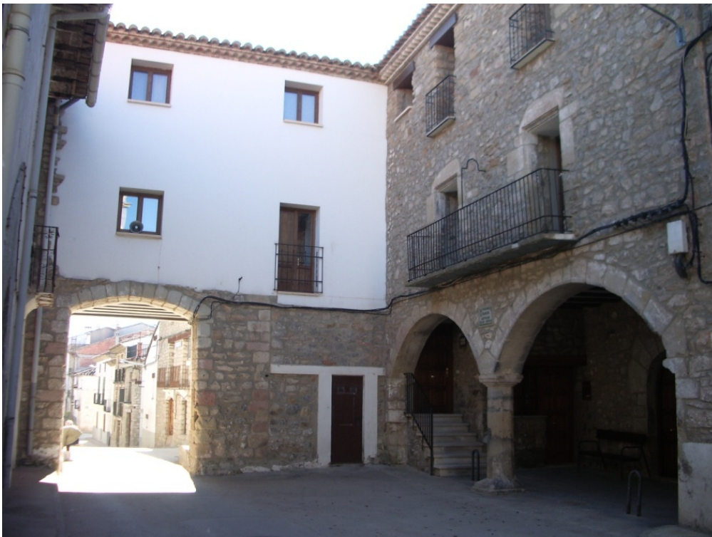
El "arco", antiguo portal de Valencia, en la zona antigua de Valbona

Otro lugar pintoresco es el monumento al pestillo romano. Esta obra fue realizada con el trabajo y la ilusión de los valboneros que participaron en la idea creativa y artística del escultor Marcelo Díaz García y la colaboración del escultor Jesús García Vicente.