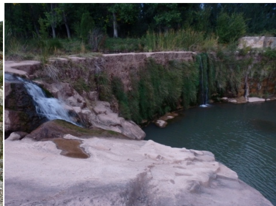
Azud de la Luz