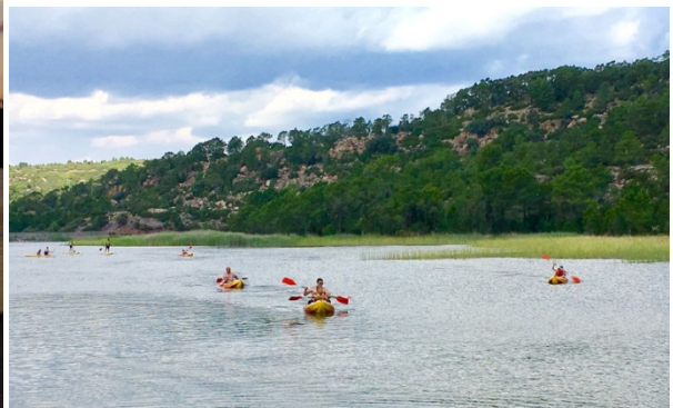
Embalse de Valbona