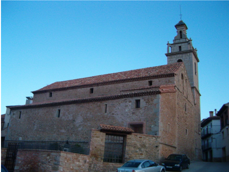
Iglesia de San Antonio Abad (Valbona)