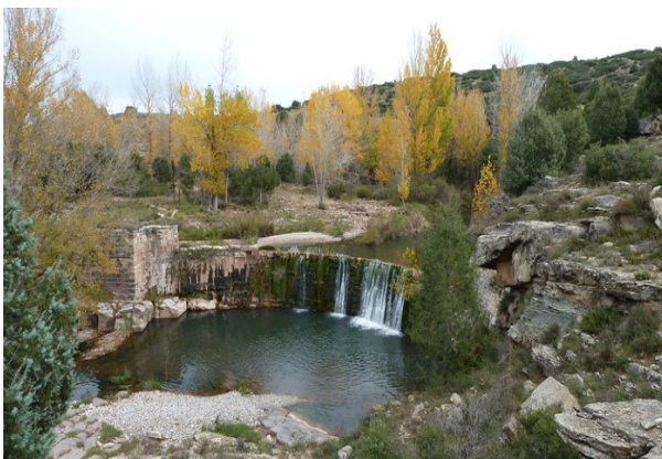
Azud de los Piquillos

También posee un importante patrimonio fluvial con varios molinos, fuentes y azudes, dentro de todos los que hay destacamos el Azud de los Piquillos, El Azud de la Luz, el de los Cesteros y Molino Pina, que pueden recorrerse a través de senderos señalizados. Cuenta también con un sendero de tipo GR( GR 8) y pasa por su término el "Camino del Cid".